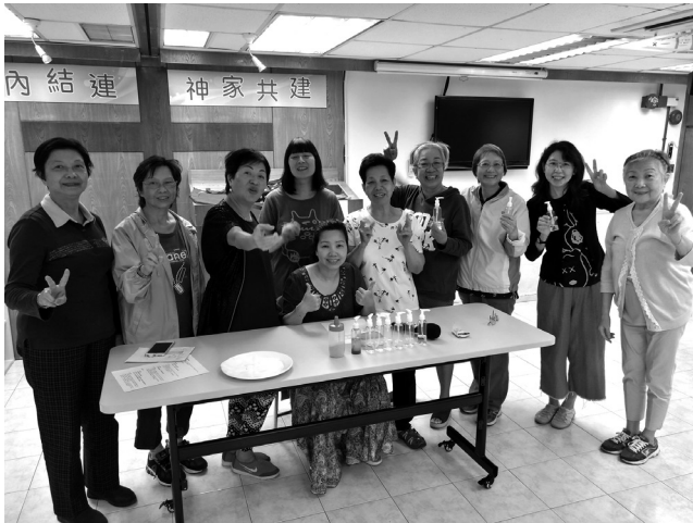
天然皮膚護理工作坊