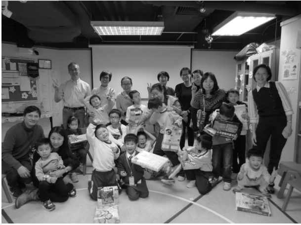
課餘託管聖誕聯歡會