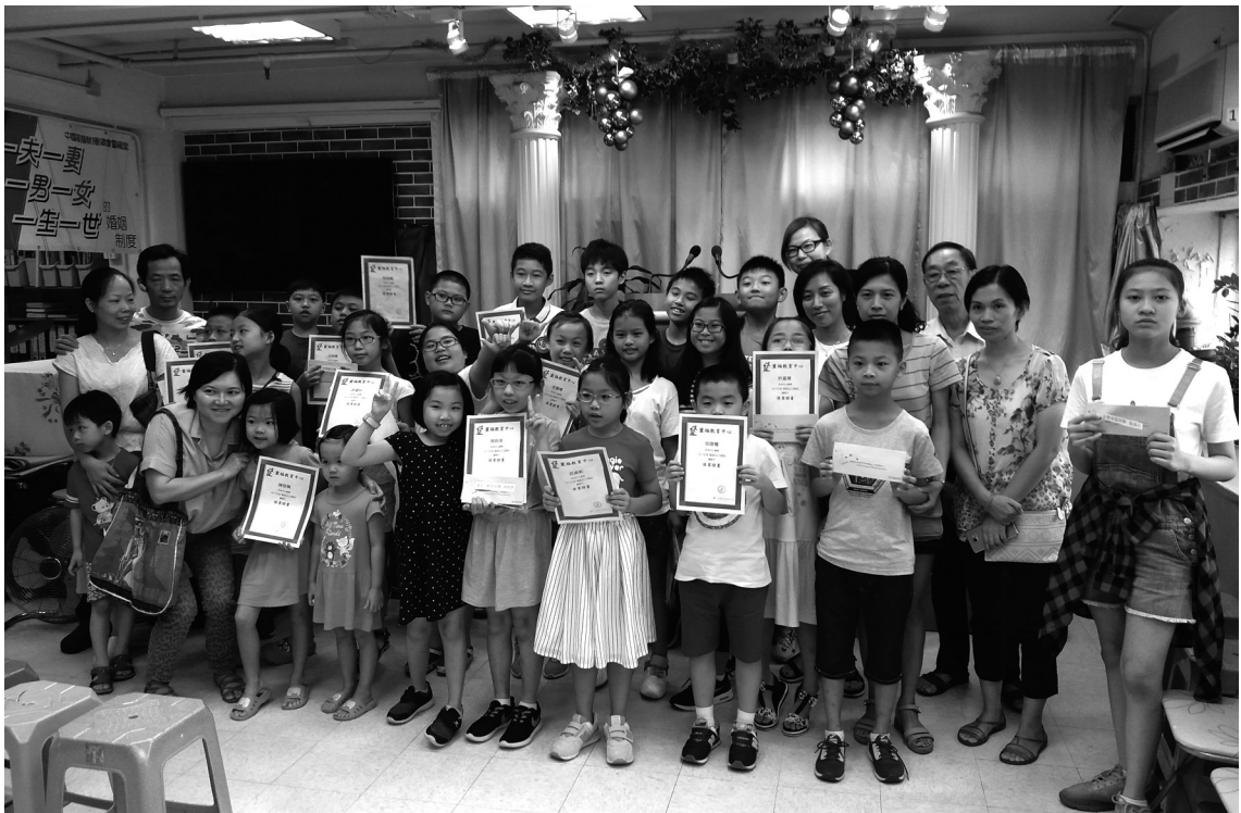
2017暑期活動結業禮暨教育中心主日