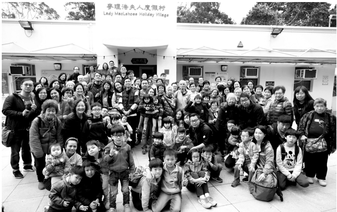
「親親自然樂恩營」教會大旅行