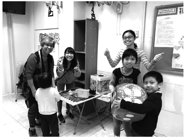
康福堂白普理社區健康發展中心日家庭同樂