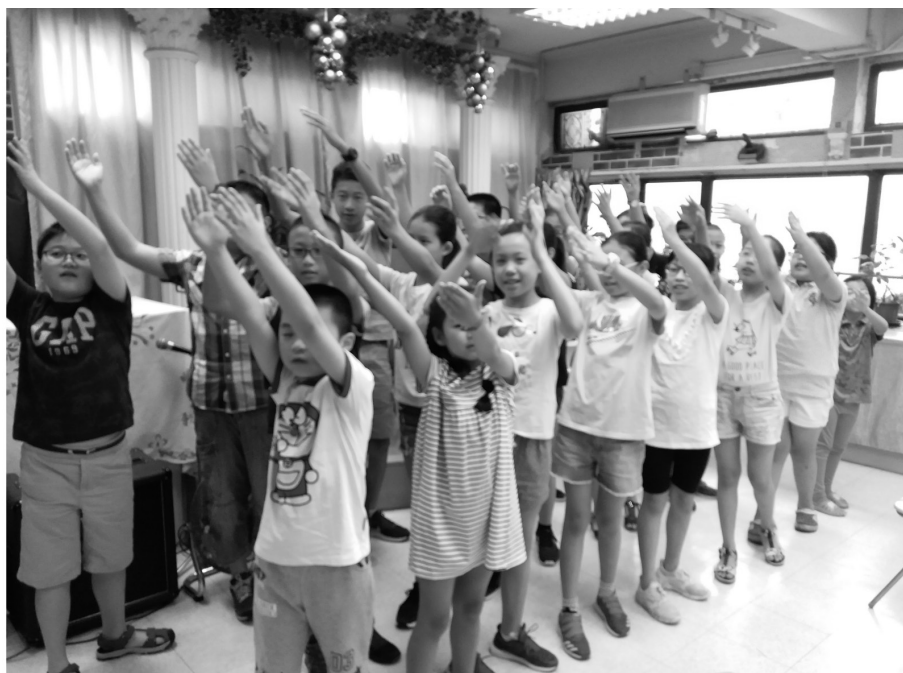
2018暑期活動結業禮暨教育中心主日