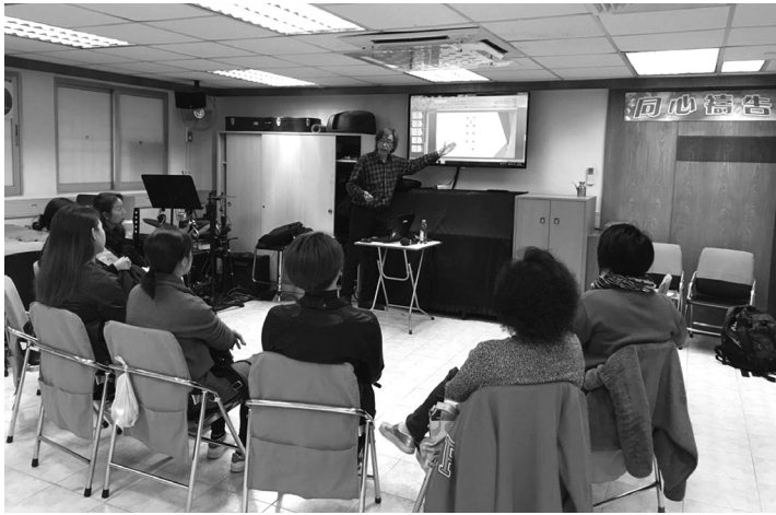
康福堂白普理社區健康發展中心FAMILY