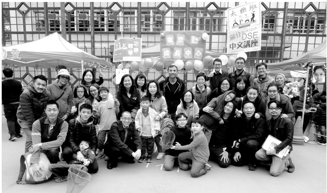
聖誕祝福社區嘉年華