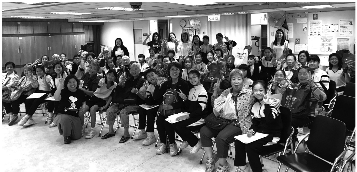
康福堂白普理社區健康發展中心童長匯