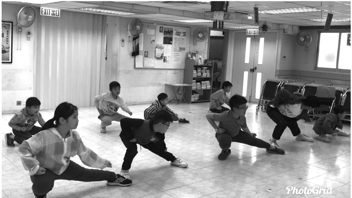
康福堂白普理社區健康發展中心功夫