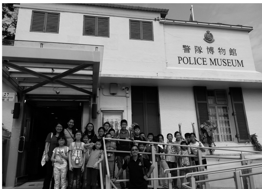
暑期活動---參觀警隊博物館