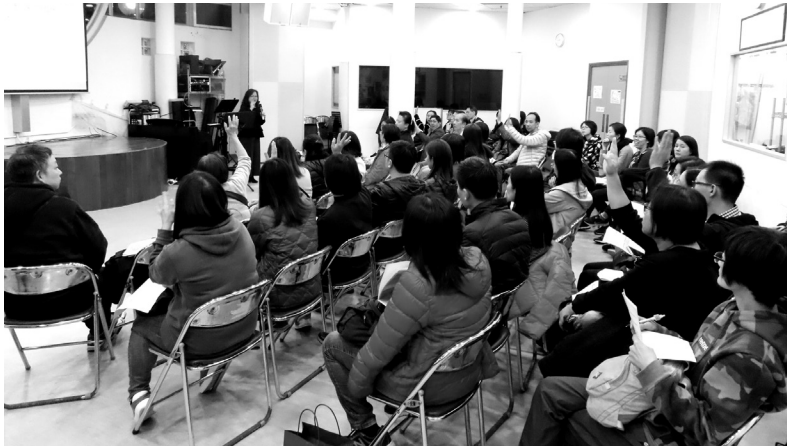
童創成長路家長講座