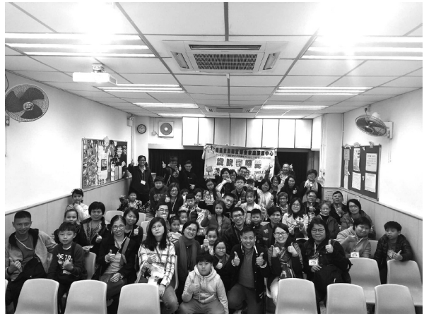
「歲晚表關愛」義工探訪日