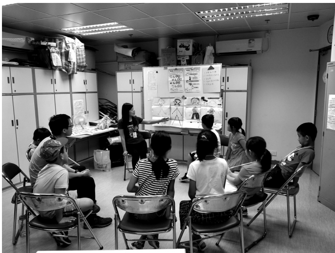
家添動力愛和平訓練