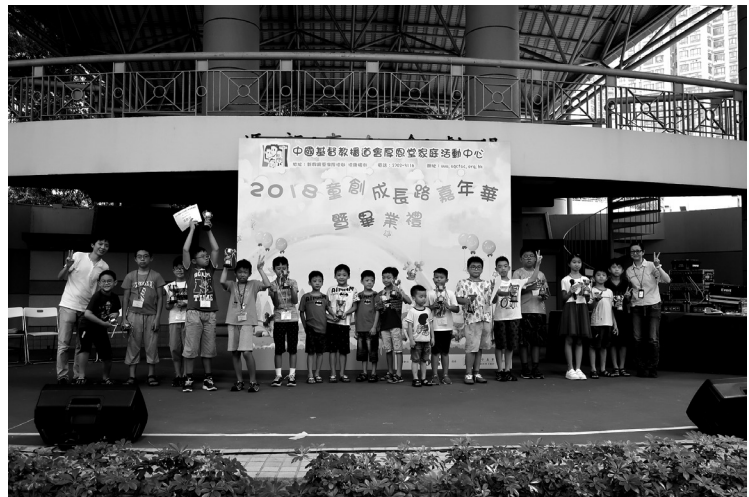
2018童創成長路嘉年華暨畢業禮