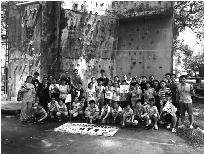
2018暑期全方位挑戰營