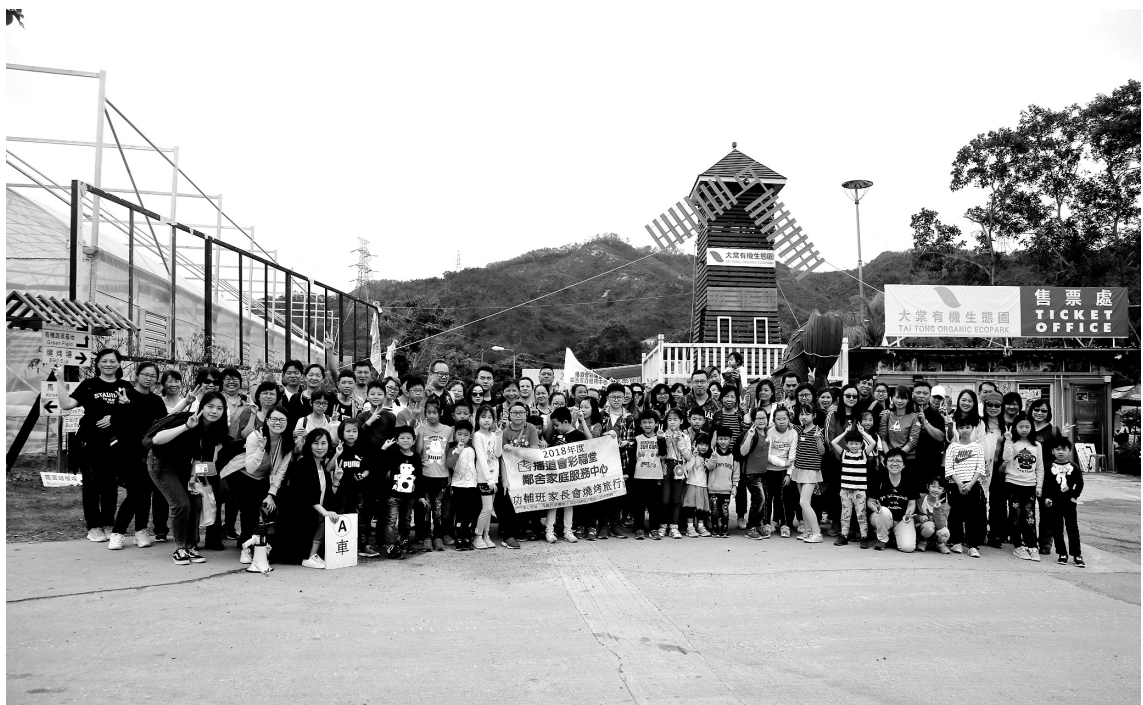
功課輔導組「家長會旅行」