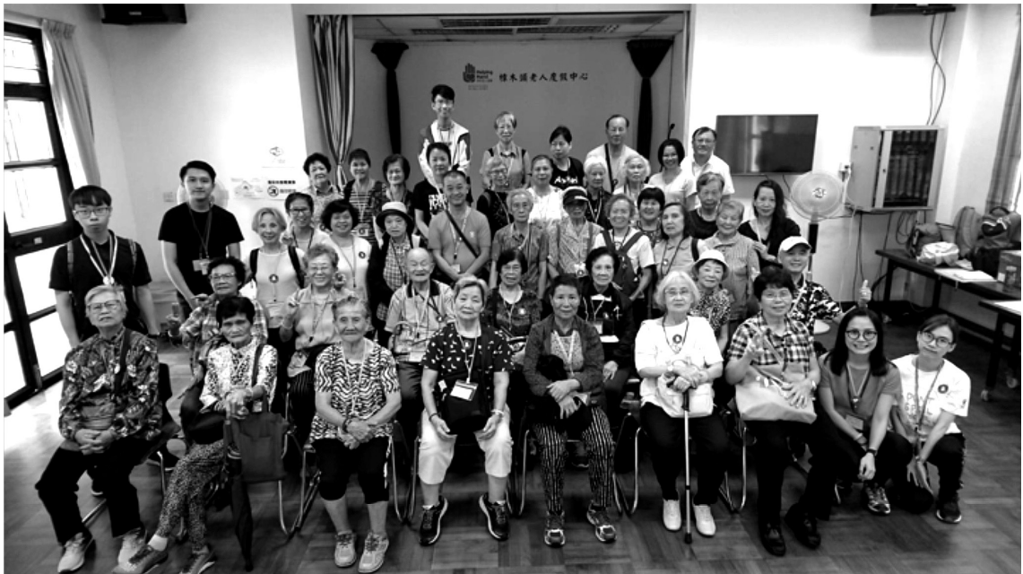
「豐彩耆樂2018-2020」 --- 樟木頭之旅