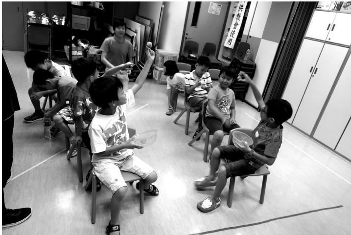
兒童小組 --- 小領袖訓練