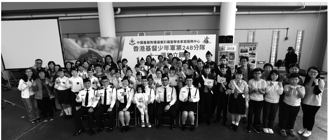
香港基督少年軍第248分隊成立十一週年立願禮