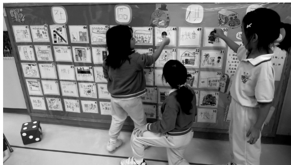
加入了有趣又可操弄的環境角落， 提升幼兒的學習動機及興趣。