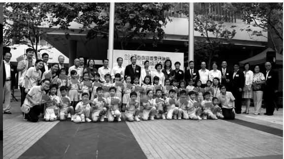
社區活動-參與升旗禮