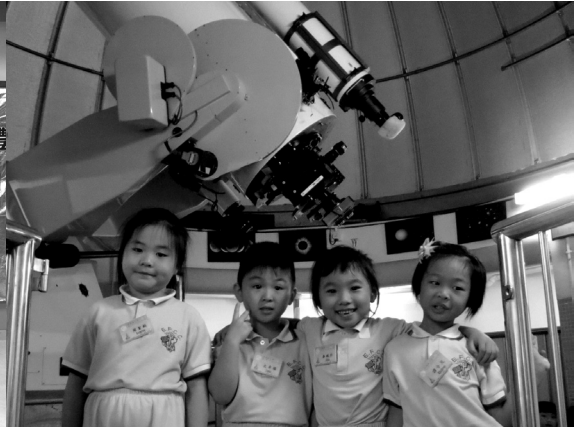
參觀可觀自然教育中心