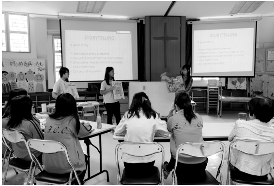
語常會之核心老師與同儕分享教學心得