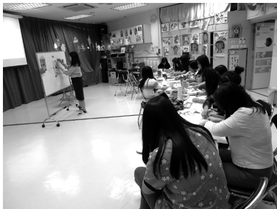
校內培訓加強老師美藝的技巧