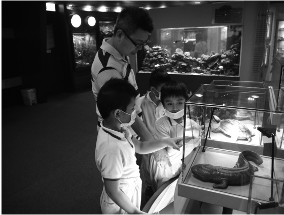
參觀瀕危物種資源中心