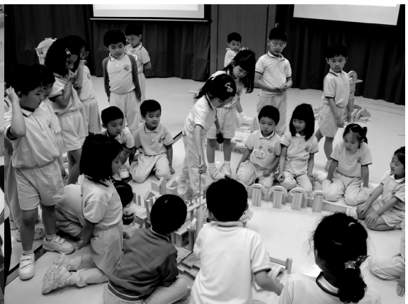
茵怡建構遊戲活動