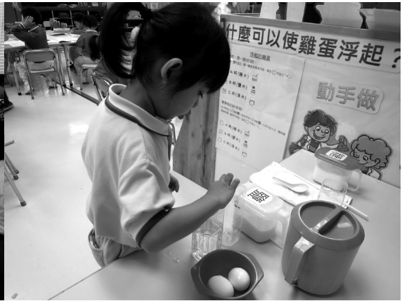
從探索活動中，自己找尋答案