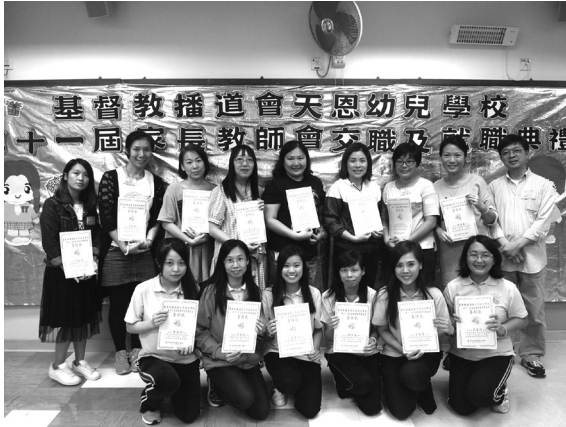
家長教師會交職禮