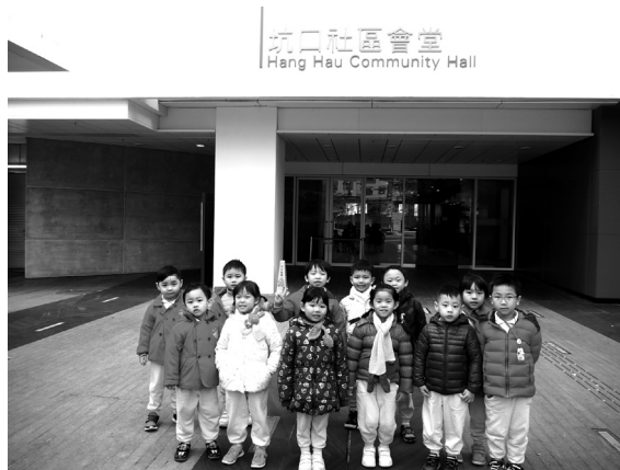
參觀坑口社區設施