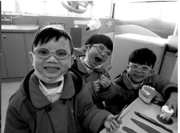
參觀陽光笑容樂園