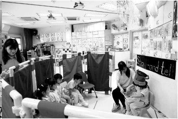
語常會導師進行觀課