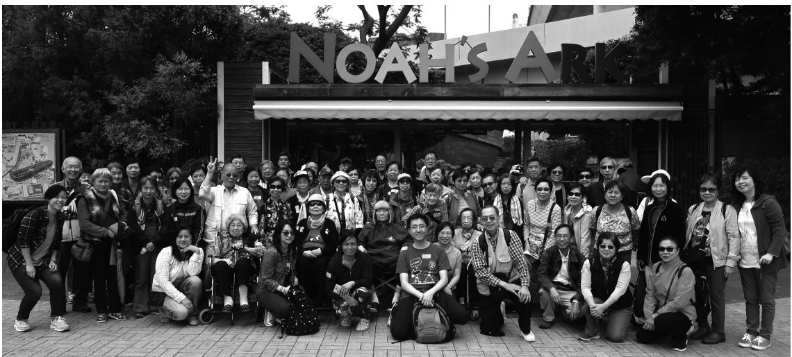
太陽館方舟一日遊