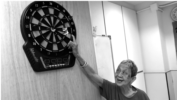
老友記玩飛鏢玩得好開心，又可以鍛鍊認知能力