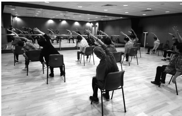
美孚長者中心班組「舞蹤舞影」的學員做熱身時也十分認真和合拍