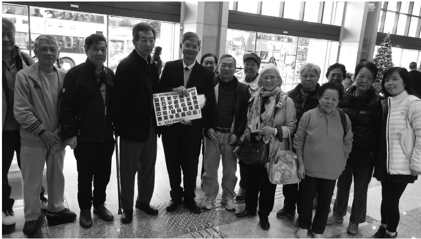
美孚長者中心與長者在張永森議員陪同下向勞工及福利事務局長羅致光局長遞交請願信