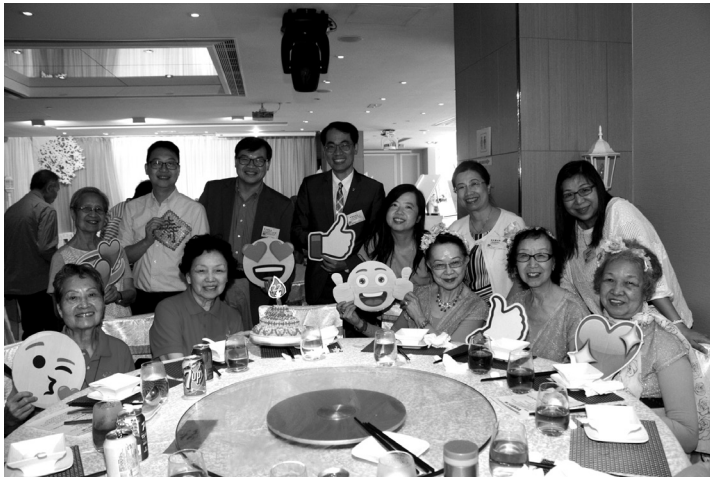
美孚長者中心奇恩堂同工、中心職員與長者同賀中心周年「歡欣樂聚廿二載」