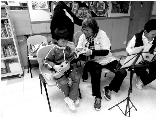
「不倒大使」到區內小學進行 「不老樂手巡迴表演」，亦教 授夏威夷小結他