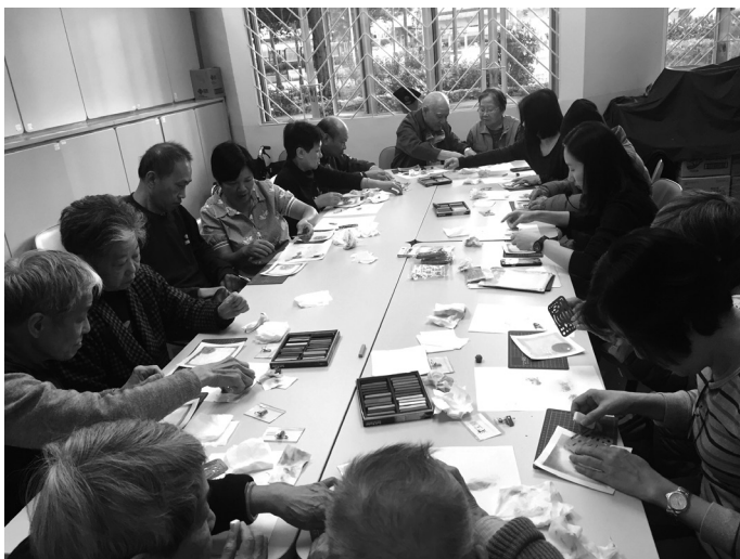
長者及護老者藝術治療活動