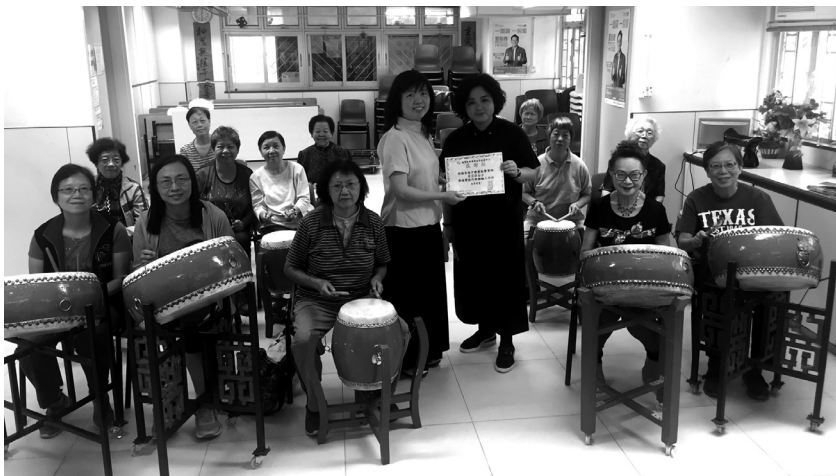
感謝香港中樂團為長者及護老者帶來精彩的擊鼓體驗