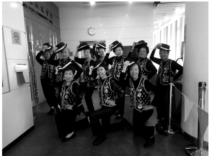
舞蹈小組於香港小童群益會美孚青少年綜合服務中心暑期活動開幕禮進行爵士樂表演