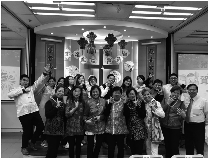
職員及長者委員會成員