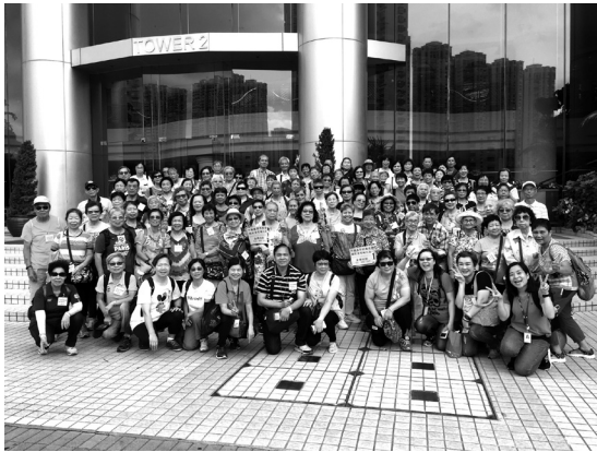
馬屎洲旅行及酒店午膳