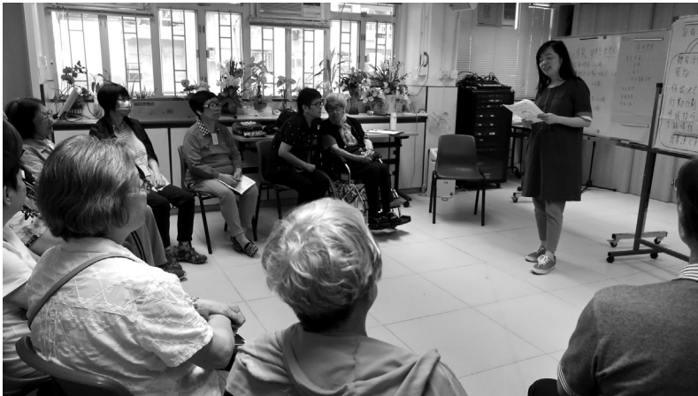
「自主心情靚」健康管理課程