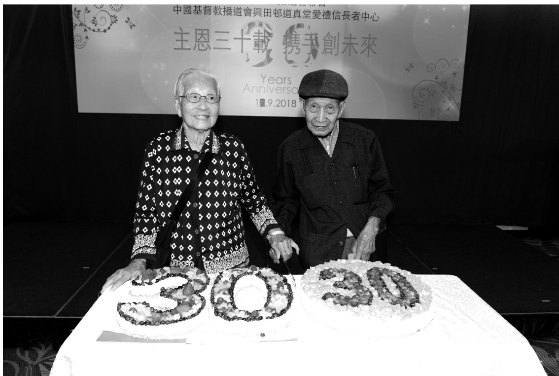
主恩三十載 攜手創美來