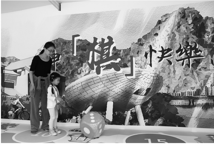
神『「棋」』快樂鳥遊樂園