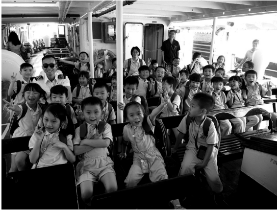
乘坐及探究渡海小輪