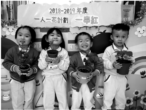
一人一花種植活動