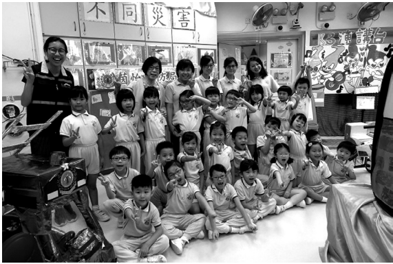
教研中心到校參觀防災的成果