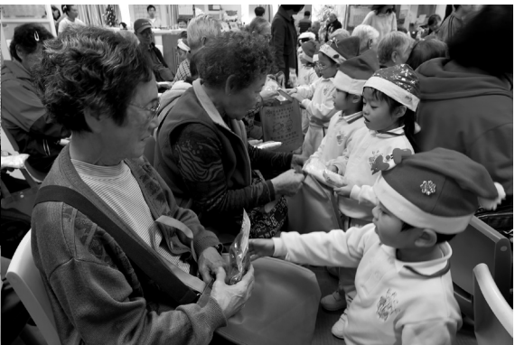
聖誕報佳音-探訪老人中心