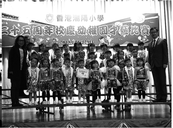
參與幼稚園才藝比賽