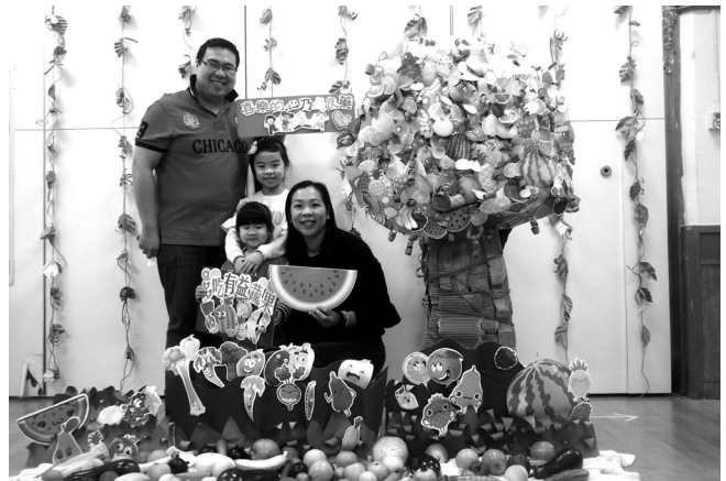
健康聖誕親子嘉年華