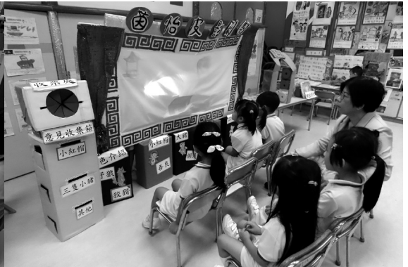
自編故事做皮影戲