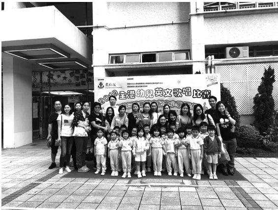
參與全港中英文歌唱比賽