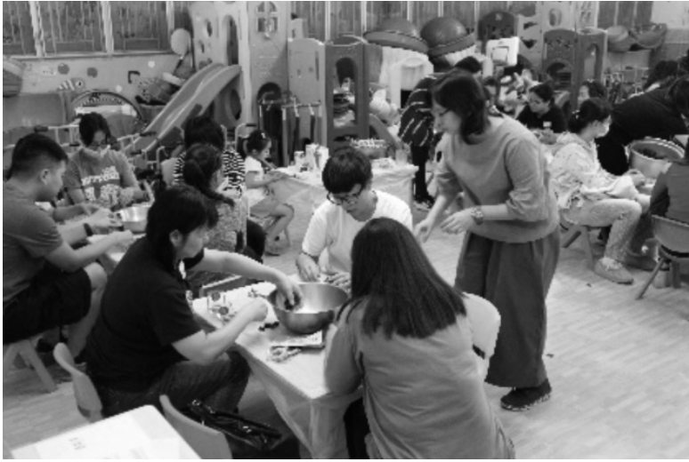
週二鬆一鬆家長活動